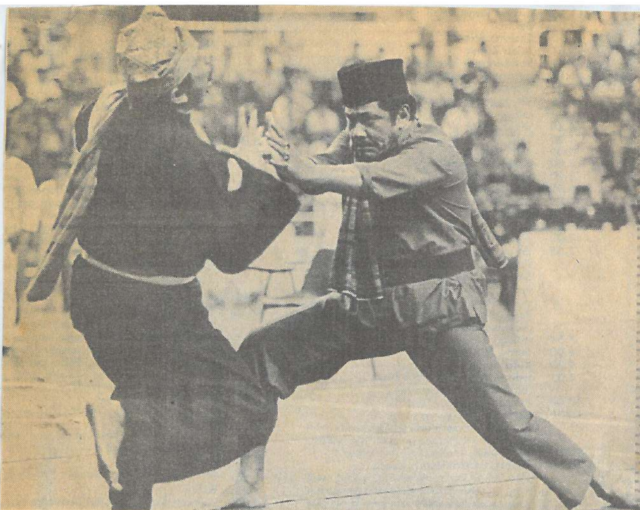
DICKY bersungguh-sungguh mengalahkan 'pasangan' lawannya.