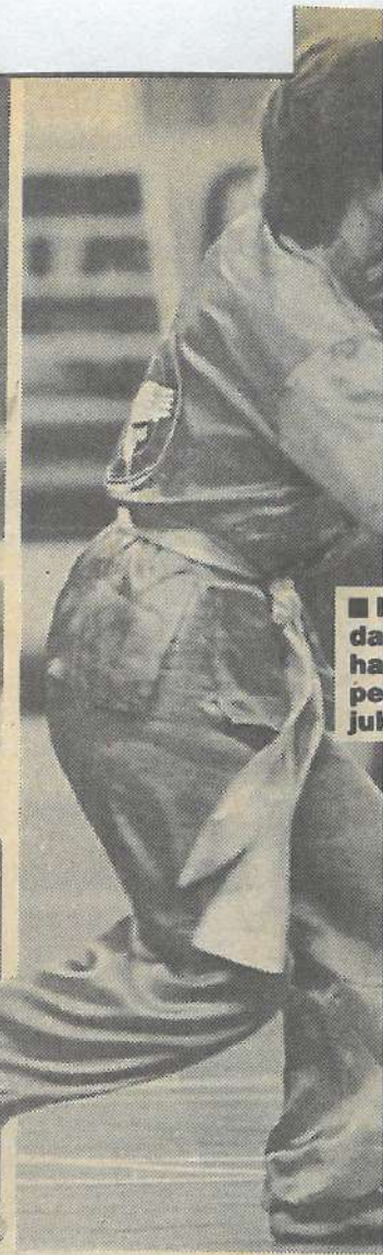
■ I da ha pe jul